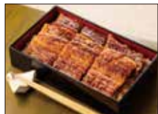
〈薬院・うなぎ処 山道〉うなぎ重 (1折).....4,644円