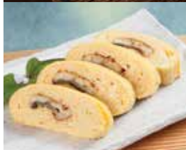
〈料亭 老松〉 う巻(4切/1パック) (25日(木)・26日(金) 各日15点限り・ 27日(土) 25点限り) 1,296円 【本館地下2階= 惣菜】