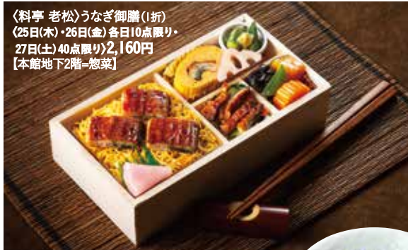
〈料亭 老松〉うなぎ御膳(1折) (25日(木)・26日(金) 各日10点限り・ 27日(土) 40点限り)2,160円 【本館地下2階=惣菜】