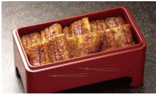
〈博多名代 吉塚うなぎ屋〉上蒲焼(6切/1折).....4,801円 ※ご予約のお渡しは、26日(金) 20点限り・27日(土) 50点限りとさせていただきます。 ※数に限りがございます。売り切れの際はご了承ください。【本館地下2階=惣菜】