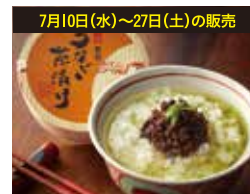
7月10日(水)~27日(土)の販売 〈野村佃煮〉うなぎ茶漬(40g) .....(50点限り)972円 【本館地下2階=惣菜】