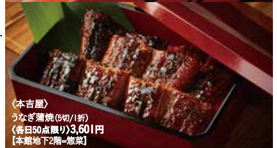
〈本吉屋〉 うなぎ蒲焼(6切/1折) (各日50点限り)3,601円 【本館地下2階=惣菜】

※〈本吉屋〉のイトインコーナーは、7月27日(土)・28日(日)の2日間はお休みさせていただきます。