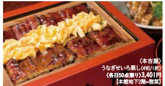
〈本吉屋〉 うなぎせいろ蒸し(4切/1折) (各日50点限り)3,401円 【本館地下2階=惣菜】