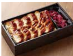
〈博多魚がし〉うなぎ重(1折) .....1,498円 【本館地下1階=鮮魚】