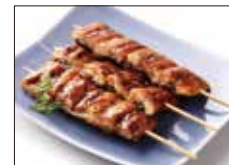
〈柳川・柳風〉鰻の蒲焼串(3本) .....2,592円