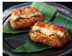
〈竹千寿〉笹ちまぎ(鰻) (1セット/80g×3個) .....(各日20点限り)1,620円 【本館地下2階=惣菜】