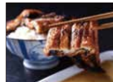
〈嬉野・森うなぎ店〉蒲焼(1尾) .....3,132円から