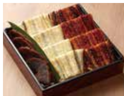
〈博多魚がし〉2色うなぎ重(1折) .....(25点限り)6,000円 【本館地下1階=鮮魚】