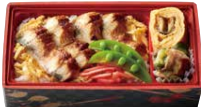
〈上村節子の旬菜キッチン〉鰻重(1折) (25日(木)・26日(金) 各日10点限り・27日(土) 30点限り)2,160円 【本館地下2階=惣菜】