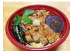
〈三重・蔵楽〉伊賀の養肝漬入り 国産鰻のひつまぶし(1折/おし付) .....2,700円