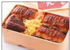
〈九州銘産品協会〉 うなぎせいろ蒸し上[1] (1折) .....2,700円