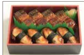
〈古市庵〉詰合せうなぎ押し寿司・にぎり (1折).....(各日20点限り)1,620円 【本館地下2階=惣菜】