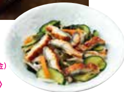
〈料亭 老松〉うざく(1パック) (25日(木)・26日(金) 各日15点限り・ 27日(土) 25点限り)756円 【本館地下2階=惣菜】

「販売期間」7月26日(金)・27日(土) ※7月24日(水)から販売しております。 岩田屋本店 本館地下1階・地下2階 食料品