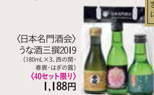
〈日本名門酒会〉 うなぎ酒三撰2019 (180mL×3、西の関・ 春鹿・はぎの露) (40セット限り) 1,188円