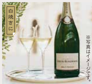
ルイ・ロデレール プリュエット ・ブルミエ (750mL) 6,221円