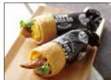
〈久留米・魚政250〉デコいなり くるっとうなぎ(1個)....381円