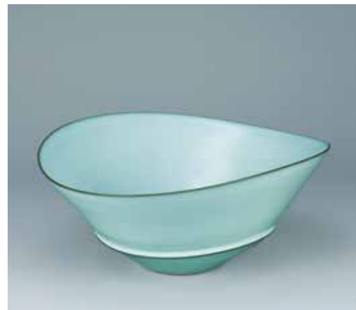
中野月白瓷蝶鉢 重要無形文化財保持者 福島 善三(陶芸)