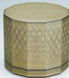
高松宮記念賞 神代杉彩線木象嵌十二角箱 桑山 弥宏