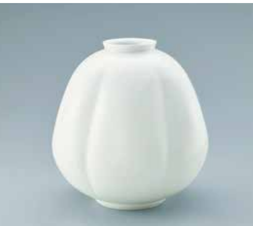
白磁瓜形壺 重要無形文化財保持者 井上 萬二(陶芸)