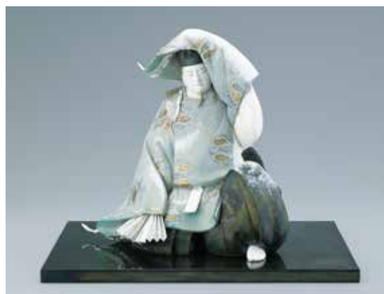
陶彫彩色「凌雪」 中村 信喬(人形)