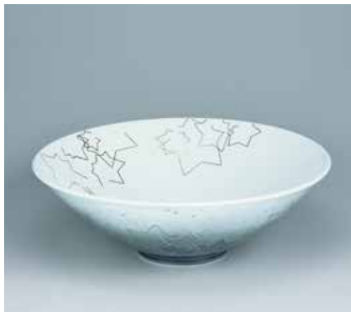
色絵雪花墨はじき紅葉文鉢 重要無形文化財保持者 今泉 今右衛門(陶芸)